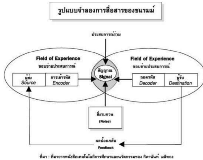
ภาพที่ 1 : แบบจำลองการสื่อสารของ Wilber Schramm และ C.E. Osgood ที่มา : เทคโนโลยีและการสื่อสารเพื่อการศึกษา (2548)